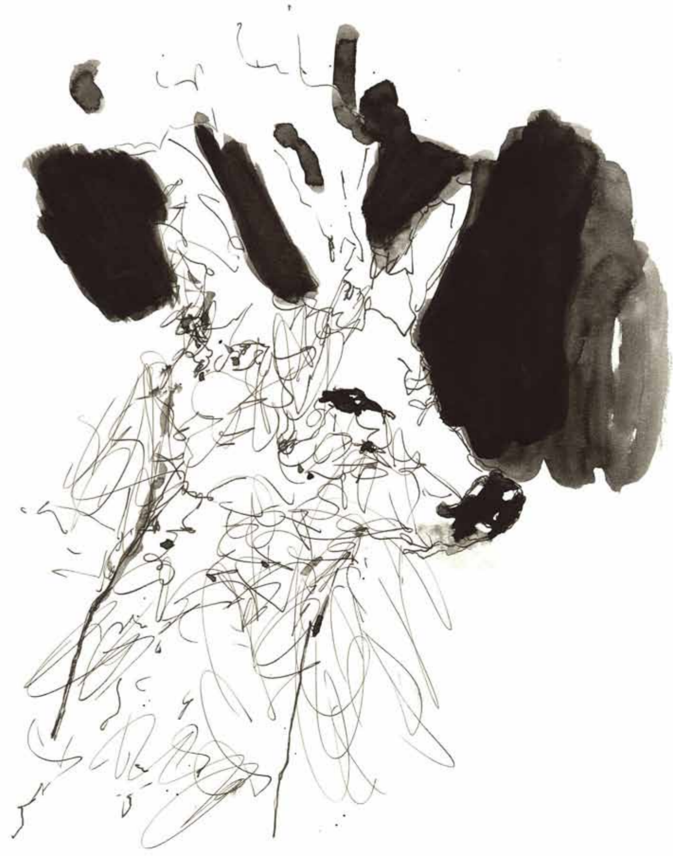
Rehbock, 2011, 32,5 x 23,5 cm Aquarell und Farbstift auf Papier