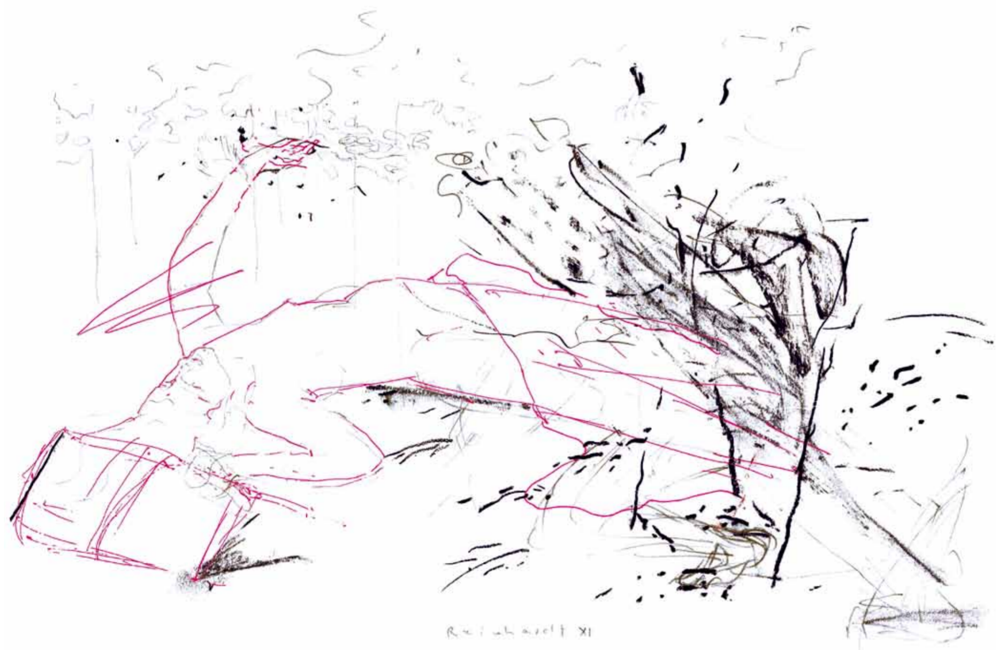
Wehen, 2011, 28 x 36 cm Farbstift, Kohle, Bleistift auf Papier Kleine Landschaft, 2011, 10 x 15 cm Farbstift auf Papier