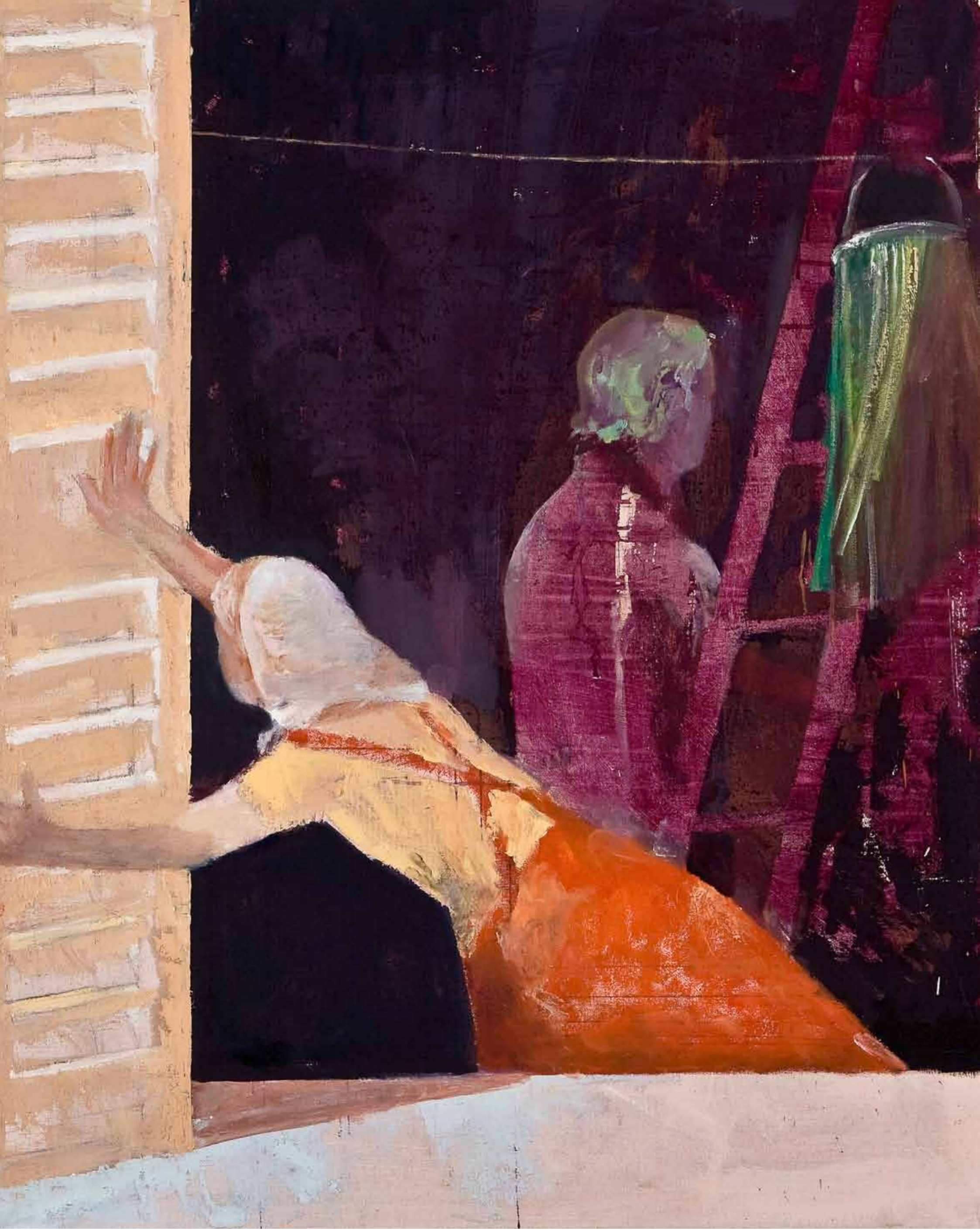
Zwei, 2010/11, 135 x 108 cm Öl auf Leinwand