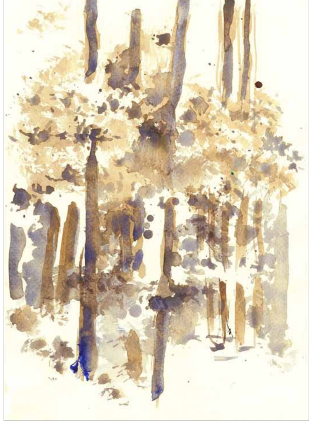
Wald I, II, III, 2007, 29,6 x 21 cm Gouache/Aquarell auf Papier